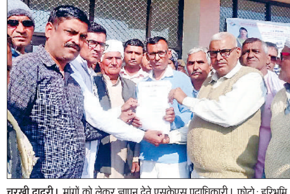
चरखी दादरी। मांगों को लेकर ज्ञापन देते एसकेएस पदाधिकारी।