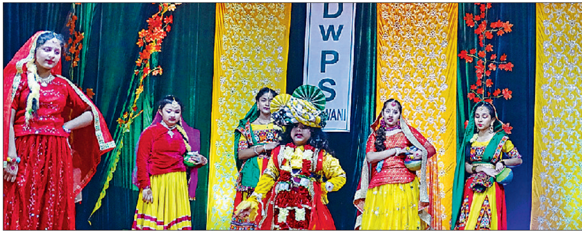
भिवानी। कार्यक्रम में नाटक का मंचन करते हुए।